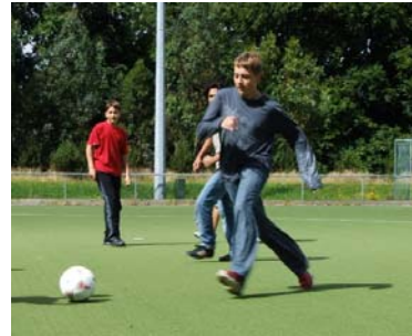
Partita di calcio