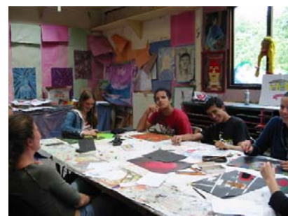
Lezione di arte